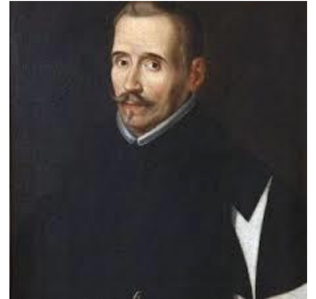
FÉLIX LOPE DE VEGA

Zapatos al uso nuevo, sotanilla a lo turquesco. Viene de Panamá.”