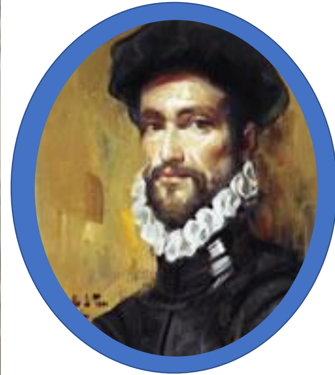
RODRIGO DE BASTIDAS